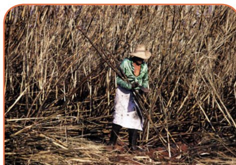
Увеличение производства сахарного тростника в Бразилии, по большей части, связано с применением этой культуры на появившемся био-топливном рынке