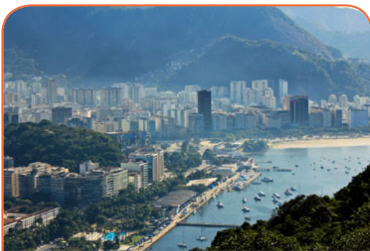
Бразилия – одна из лидирующих стран в области инновационных сельскохозяйственных технологий

Бразилия всегда имела тесные связи с Португалией. Португальцы по происхождению управляли Бразилией на протяжении многих лет до обретения независимости, ввели официальный язык и многое другое. Некоторые коренные группы в Бразилии, стоявшие на пути развития, были “смещены”, что позволило завоевать их земли. Даже сегодня по-прежнему ведутся споры о владении тропическими лесами.