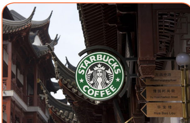
Транснациональные корпорации узнаваемы по всему свету

Наши жизни связаны с жизнями других рядом физических и виртуальных связей. Когда мы используем интернет, наш запрос на веб-страницы достигает компьютерные серверы в различных уголках мира. Наши ТВ-программы могли транслироваться из космоса, а крупное спортивное событие будет повелевать миллиардной аудиторией.