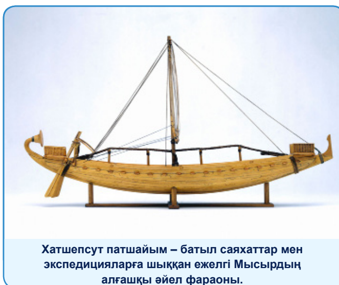
Хатшепсут патшайым – батыл саяхаттар мен экспедицияларға шыққан ежелгі Мысырдың алғашқы әйел фараоны.